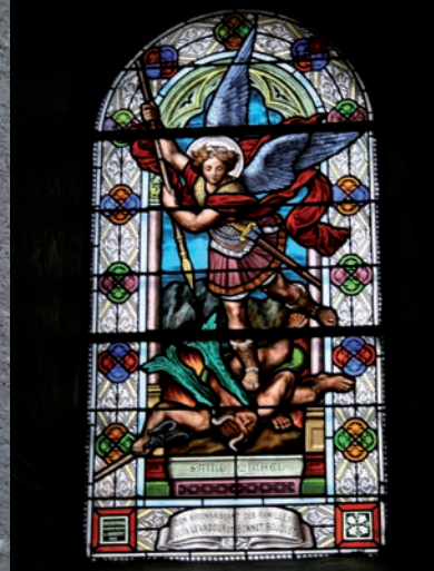
Saint Michel, vitrail, XIX e siècle