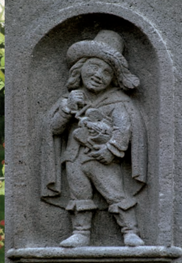
Joueur de vielle à roue, bas relief