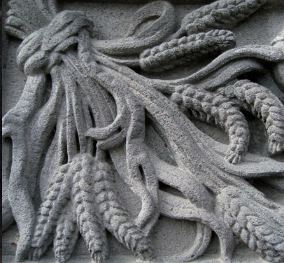
Croix de mission, détail, 1862