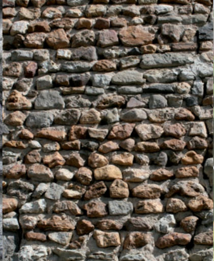
Mur de moellons