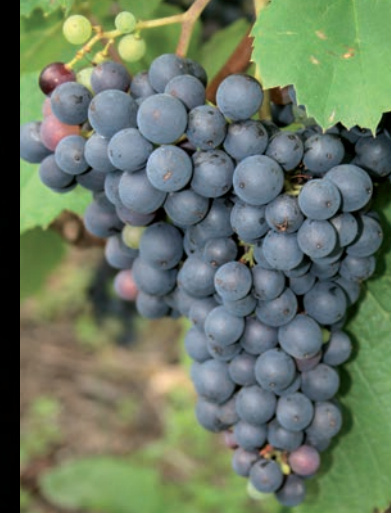
Dans les vignes