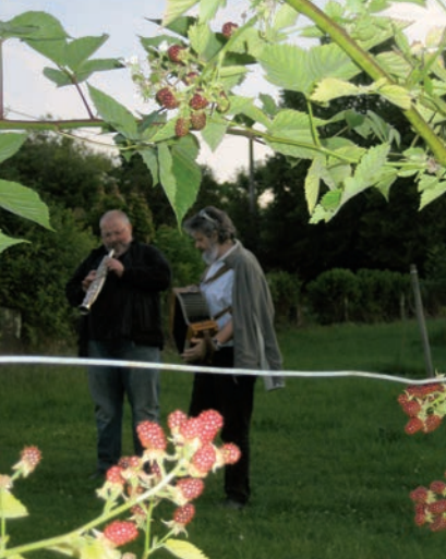
Promenade musicale avec Les Brayauds