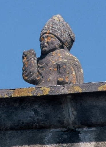
Saint Bonnet bénissant