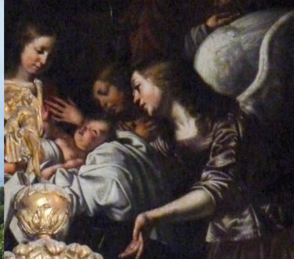
Adoration des Bergers, détail, XVII e siècle