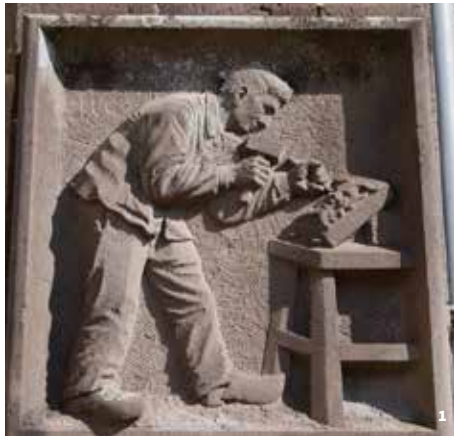
1. IMAPEC, La Sculpture , 1910 2. Croix de mission 3. Château Brosson 4. Fontaine aux lions cornus