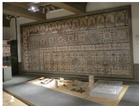
1. Anse avec le château des Tours.