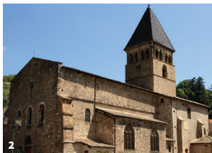
1. Manifestation gymnique au promenoir en 1912