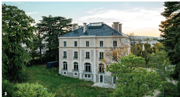
3. La maison Vermorel