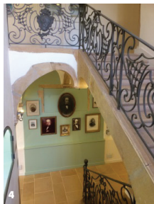
3. Le musée Claude Bernard et son parc à Saint-Julien