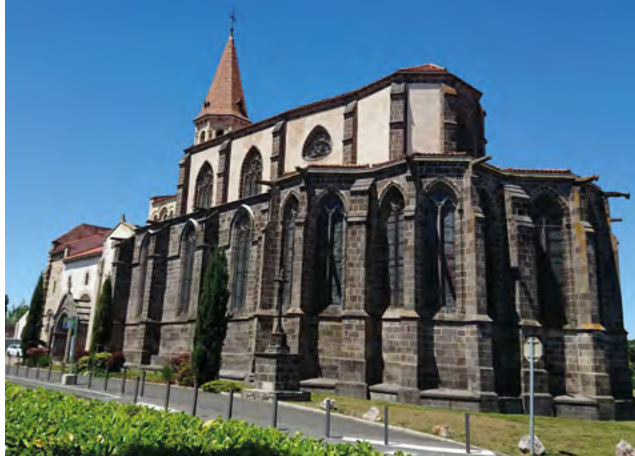
Ancienne collégiale Saint-Victor-et-Sainte-Couronne - Ennezat.