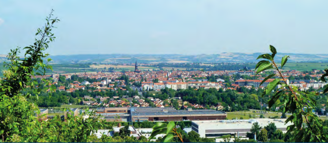
Vue de Riom et de la plaine de la Limagne.