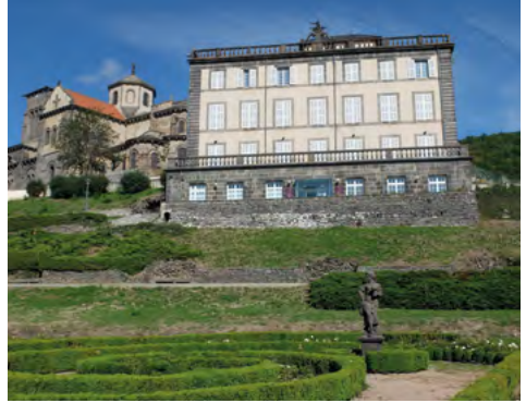
Église Saint-Priest, château et jardins de Bosredon - Volvic.

La dynamique d'une collectivité se traduit par la qualité de l' offre touristique, patrimoniale et culturelle. Le Pays d'art et d'histoire y participe activement avec des propositions et des présentations adaptées à ce public et à ses différentes pratiques.