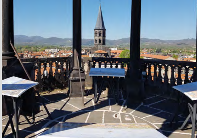
Vue du haut de la tour de l'Horloge - Riom.