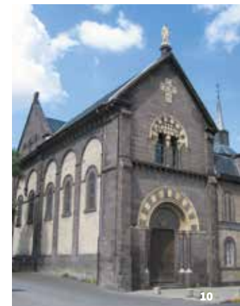
10. Chapelle de la Visitation