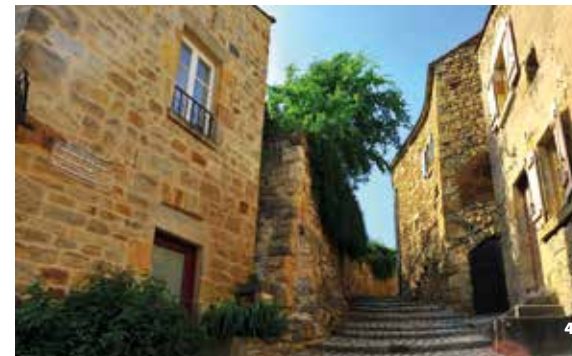
4. Montée des Tisserands