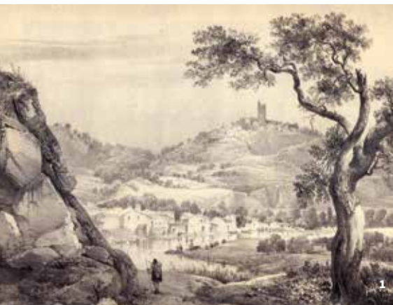
1. Les gorges de l'Allier, Coudes et Montpeyroux, gravure ancienne