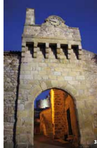
3. Porte fortifiée (fin 14 e - début 15 e siècle)

Montpeyroux est un bourg médiéval organisé selon un plan radioconcentrique, autour du donjon élevé au point le plus haut. Le village était enfermé dans une vaste enceinte flanquée de tours, dont le tracé ovoïde s'observe au nord et à l'est. Elle s'ouvre par une porte fortifiée du 15 e siècle. Malgré l'abandon puis la reconstruction du quartier ancien, on repère des éléments d'architecture de la fin du Moyen-Âge : linteaux en accolade, baies à croisée.