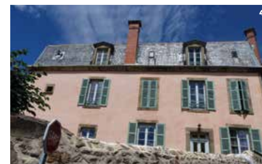
4. Maison vigneronne de la fin du 19 e siècle, rue des Perreux

ture aménagée dans la voûte circulaire. L'accès actuel date du 15 e siècle. Un escalier courbe pris dans l'épaisseur du mur dessert le 2 e étage, à fonction résidentielle : latrines coussièges, vestiges d'une cheminée monumentale (conduit d'évacuation, chapiteaux à feuillages).