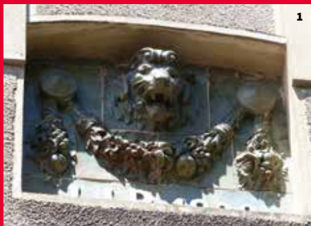
1. Maison la Kasbah. Détail du décor, cour intérieure