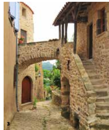
3. Maison vigneronne, rue des Pradets

L'accès initial se situait au 1 er étage, relié à la réserve du rez-de-chaussée par une ouver-