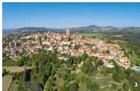
2. Vue aérienne