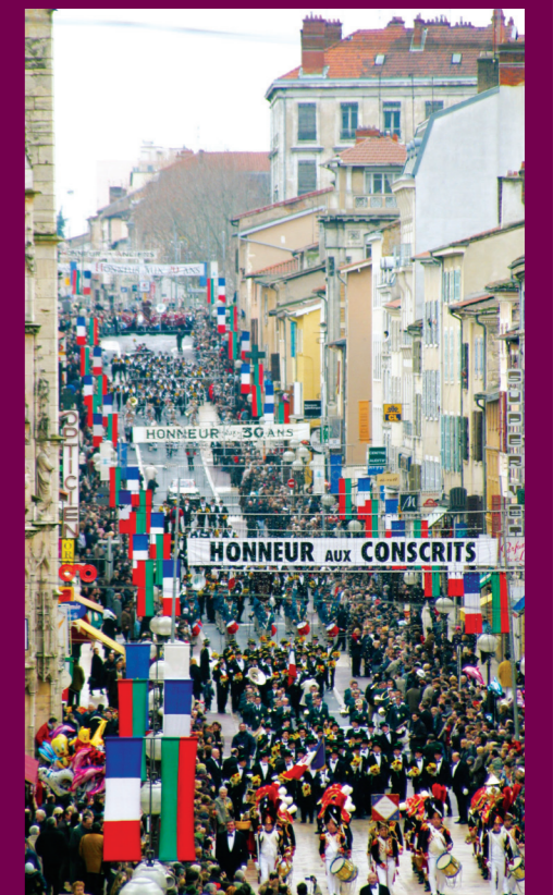
La vague des conscrits, rue Nationale à Villefranche-sur-Saône, 2004