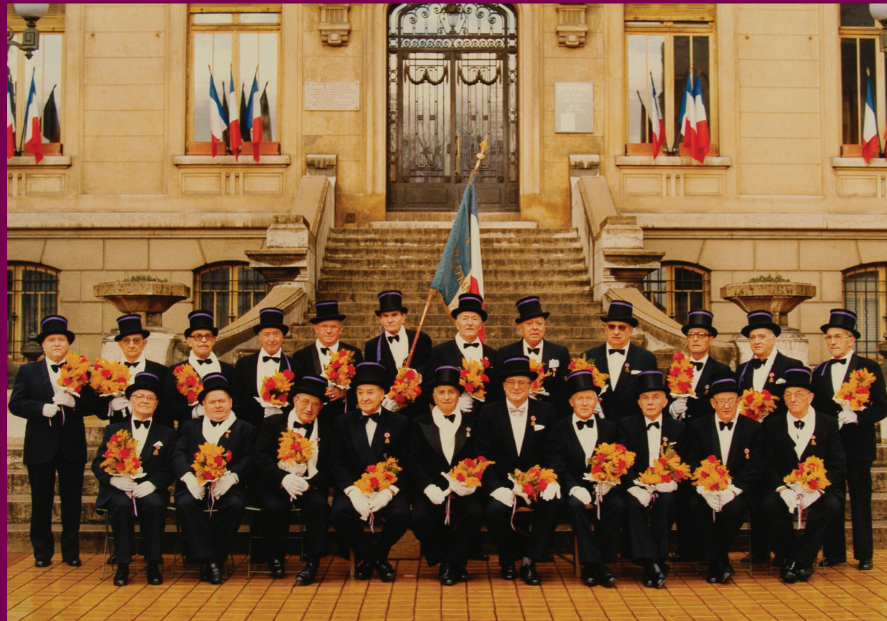
Des conscrits de 80 ans réunis devant l'hôtel de ville de Villefranche-sur-Saône, 1952

En 1940, malgré la guerre, les conscrits défilent en costume de ville.