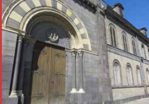
Chapelle du couvent de La Bade, Riom.