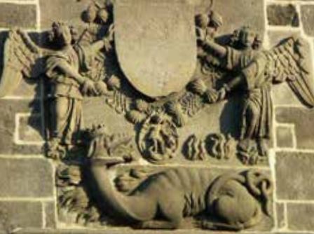
Salamandre et écu bûché, tour de l'Horloge, Riom

Vue aérienne du domaine de l'Abbaye, Mozac.