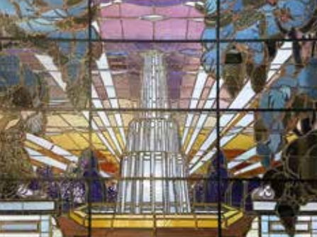
Vitrail, Marcelle Russias, ancien Grand-Hôtel, Châtel-Guyon.

Vue sur l'église Saint-Priest et sur le musée Marcel-Sahut, Volvic.