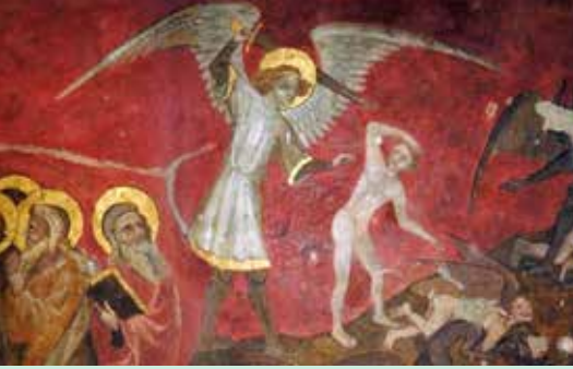
Saint Michel, Jugement dernier de la collégiale d'Ennezat.