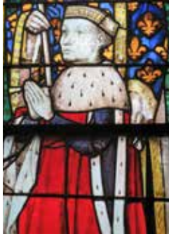
Charles 1 er de Bourbon, verrières de la Sainte-Chapelle, Riom.