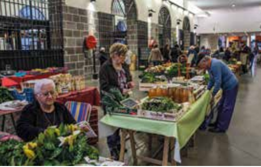
Marché de Riom, reportage de l'Atelier Photo Riomois.